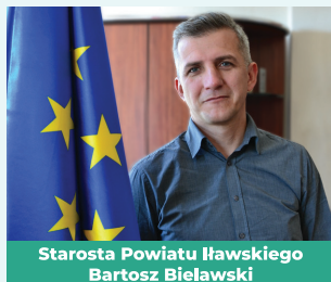
Starosta Powiatu Iławskiego Bartosz Bielawski

dofinansowany ze środków Europejskiego Funduszu Rozwoju Regionalnego w ramach Regionalnego Programu Operacyjnego Województwa Warmińsko-Mazurskiego na lata 2014-2020.