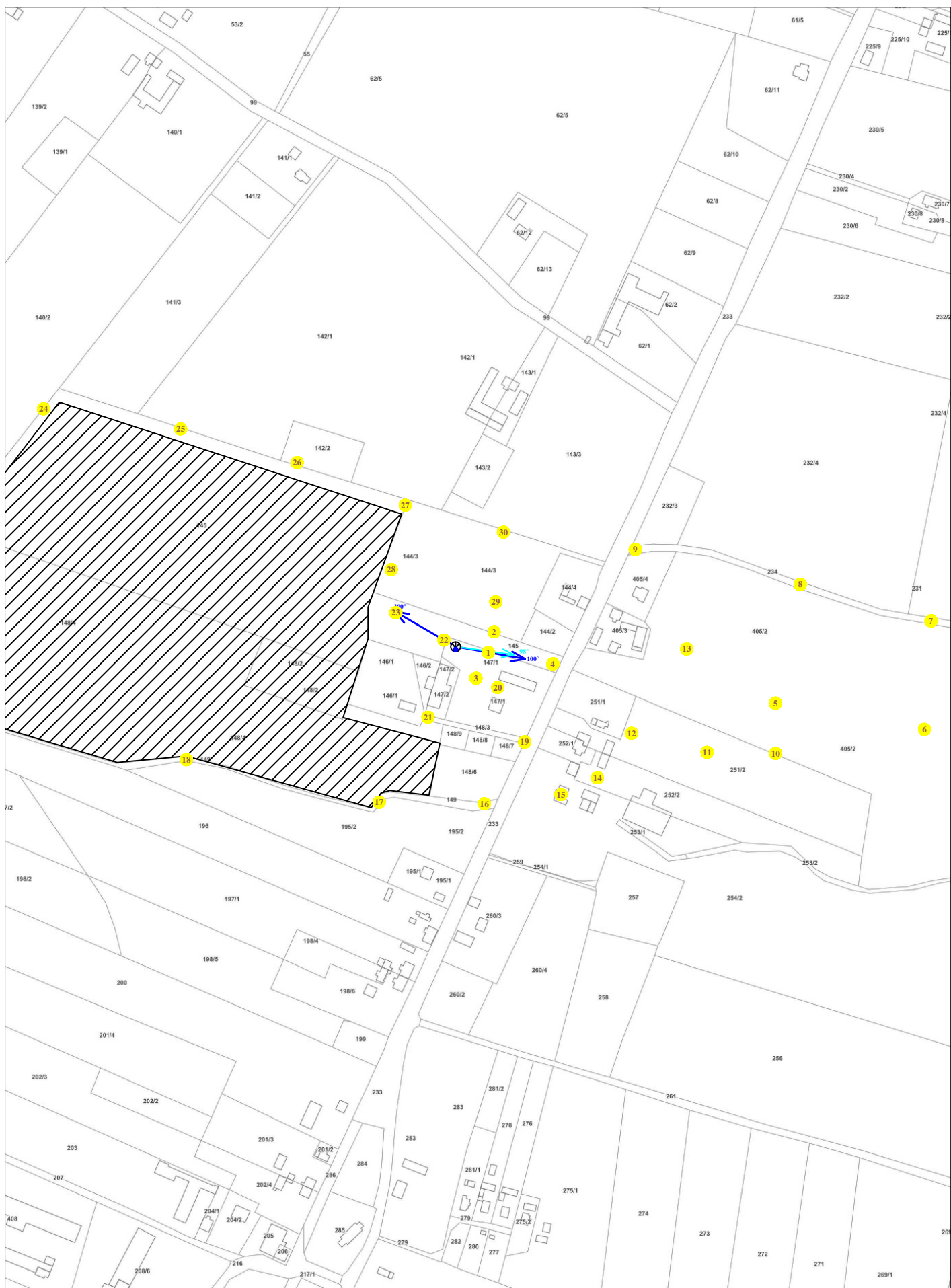
Rys. 2 Lokalizacja pionów pomiarowych

Legenda: brak dostępu antena radiolinowa źródło PEM pion pomiarowy antena sektorowa