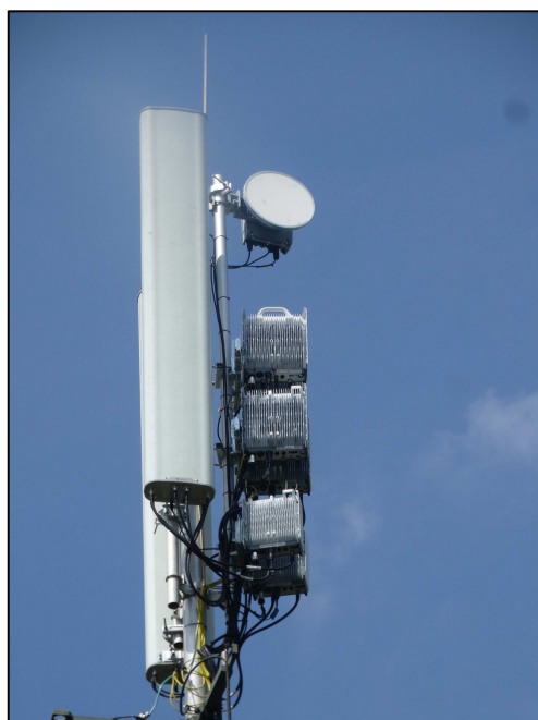
Rys. 3 Widok badanego obiektu